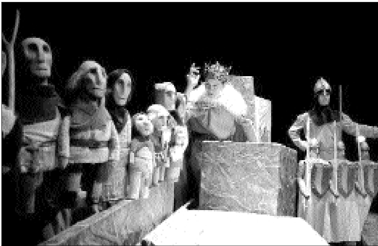
Atracción que será presentada na XXIII Mostra de Teatro Cómico de Cangas.

Outra das apostas desta edición é o espectáculo dos portugueses Circolando titulado Charanga . Os xardíns do Señal serán o escenario no que se desenvolva o espectáculo poético e visual desta compañía que parte das terras esquecidas á procura de historias que perduran nos